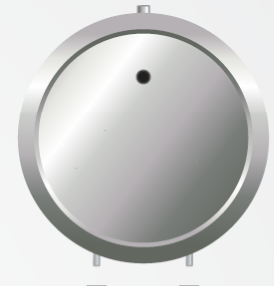
Tuercas y Tornillos (4)